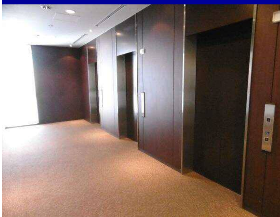
木目調で高級感ある仕上がり