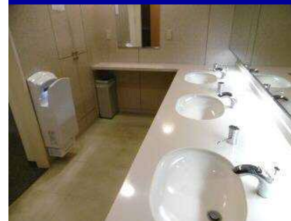
清潔感のある水回りコーナー