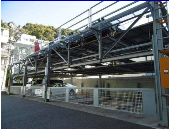
台数の充実した駐車場