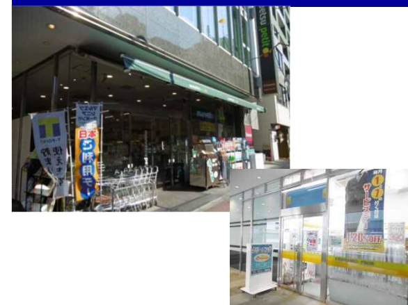
公私問わず便利な24時間スーパー ビジネスマンに優しいクリーニング店