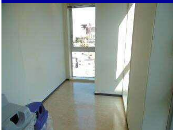
共用部に快適なプライベートスペース