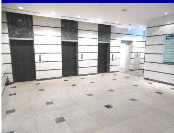
開放感のあるエントランスホール